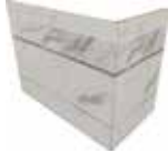
J87463 20x10x15 (8"x 4" x 6")