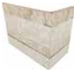
J87460 20x10x15 (8"x 4" x 6")