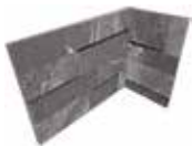
J87469 20x10x15 (8"x 4" x 6")