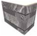
J87464 20x10x15 (8"x 4" x 6")