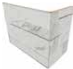
J87461 20x10x15 (8"x 4" x 6")