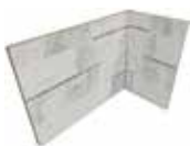
J87466 20x10x15 (8"x 4" x 6")