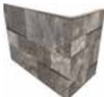
J87462 20x10x15 (8"x 4" x 6")