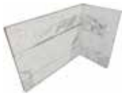
J87468 20x10x15 (8"x 4" x 6")