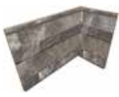
J87467 20x10x15 (8"x 4" x 6")