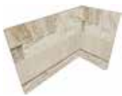
J87465 20x10x15 (8"x 4" x 6")